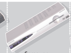
Samsung DTB 9401 V