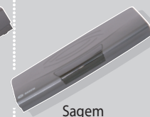
Sagem ITD62 SW