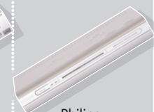
Philips DTR 320/00