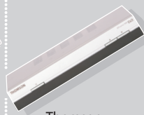
Thomson DTI series 1000