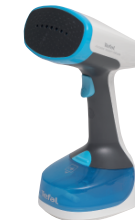
Tefal Access Steam Minute