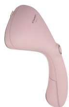
Steamery Cirrus No.2 Steamer