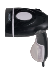
Jula Menuett, Portabelt ångstrykjärn, 1300 W