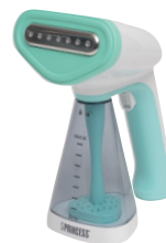
Princess Steamer Portabel Travel