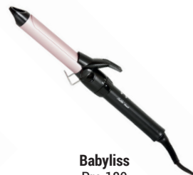
Babyliss Pro 180