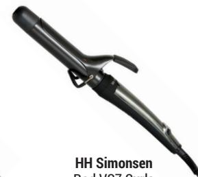
HH Simonsen Rod VS7 Curls