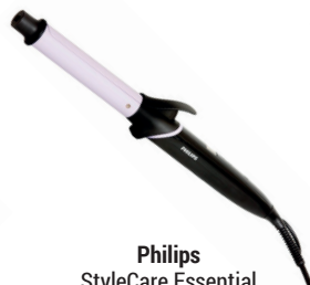
Philips StyleCare Essential