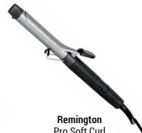
Remington Pro Soft Curl