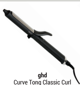
ghd Curve Tong Classic Curl