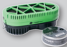
MyFC Powertreck 2.0