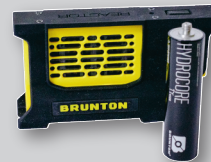
Brunton Hydrogen Reactor