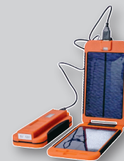
Powertraveller Powermonkey extreme