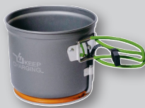
Power Practical Power Pot