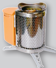
Biolite Camp Stove