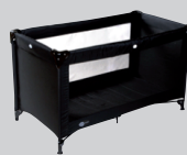
Babyproffsen Babysleep Basic