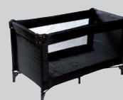
Jysk Travelbed Samson