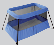
Babybjörn Crib Light