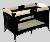
Carena Alu Travelbed