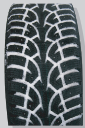
Gislaved Nordfrost 3