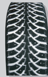
Nokian Hakkapeliitta 4