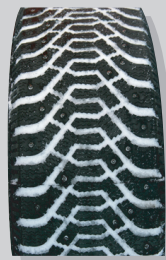
Goodyear Ultra Grip 500